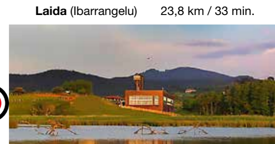
Laida (Ibarrangelu) 23,8 km / 33 min.