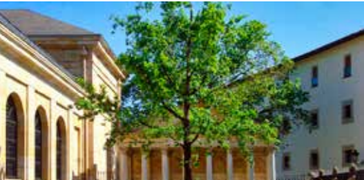
Bermeo 3,1 km / 6 min.