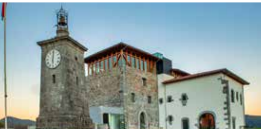
Gernika-Lumo 12,9 km / 19 min.