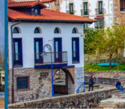
The Library La bibliothèque