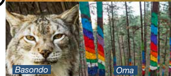
Basondo and Oma