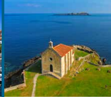
Hermitage of St. Catherine Ermitage de Santa Catalina