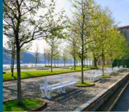
The Atalaya viewpoint Le belvédère de la Atalaya