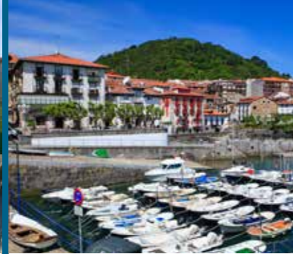
The port Le port