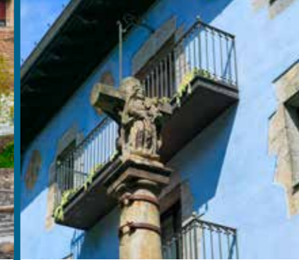
The Calvary Cross Croix du Calvaire