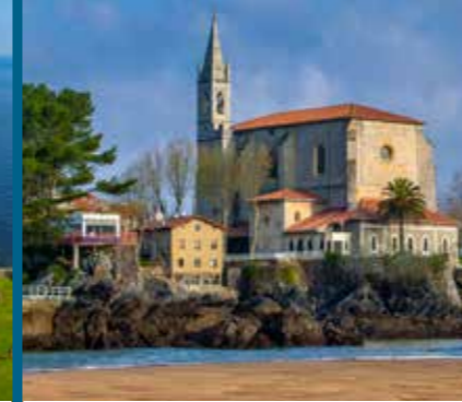
St. Mary's Church Église de Santa Maria